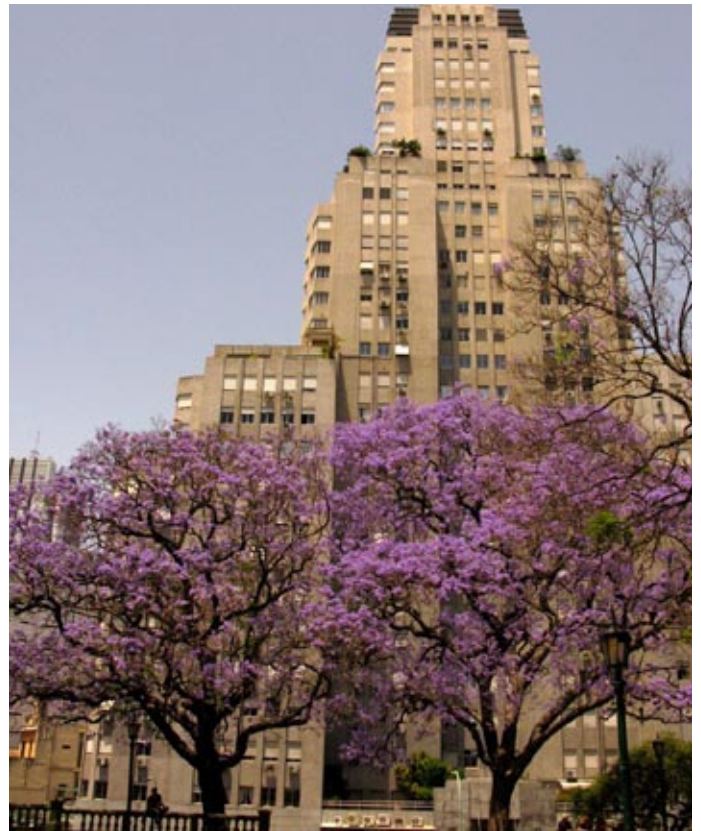
JACARANDÁS EN PLAZA SAN MARTÍN, BUENOS AIRES