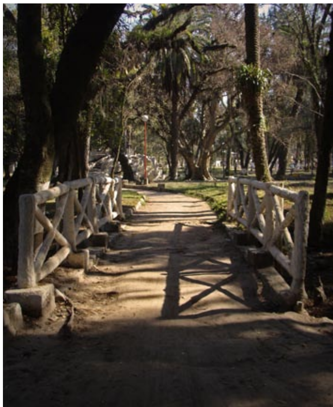
PARQUE HILERET, TUCUMÁN

Esta historia se inicia en el Parque de Santa Ana al sur de Tucumán que fuera construido a instancias del dueño del ingenio homónimo, don Clodomiro Hileret, un inmigrante/empresario de origen francés. En 1889 Clodomiro Hileret y Lídoro Quinteros adquirieron las tierras denominadas “Estancias de Santa Ana” que ocupaban una superficie de alrededor de 27.000 ha. →