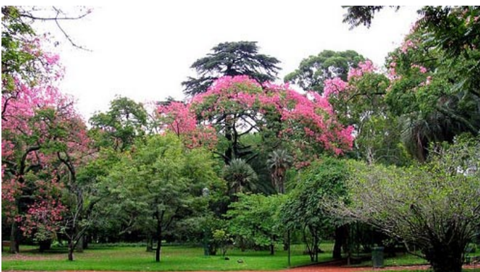
LAPACHOS EN EL JARDÍN BOTÁNICO, BUENOS AIRES