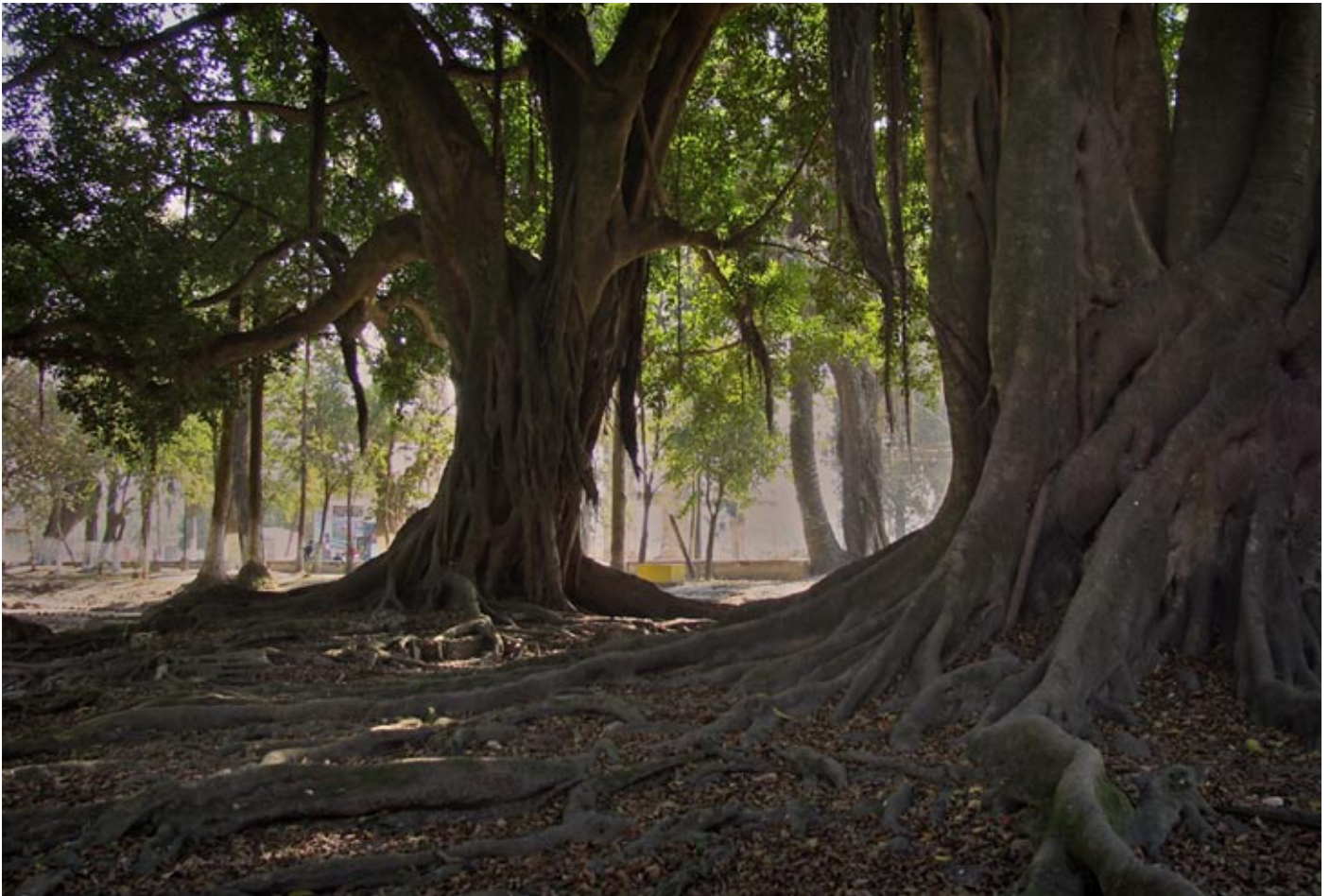
FICUS EN EL PARQUE HILERET, TUCUMÁN