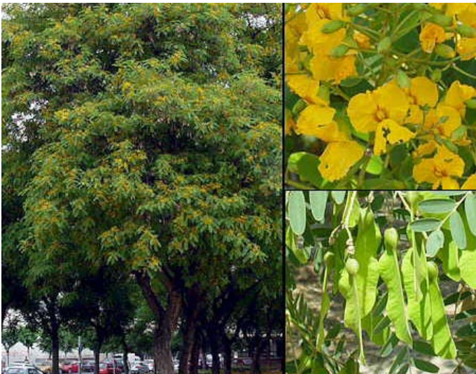
TIPAS EN EL JARDÍN BOTÁNICO, BUENOS AIRES

Hileret trajo desde Francia al paisajista más famoso del momento, Carlos Thays, para encargarse del diseño y creación del parque. El Parque de Santa Ana –como se lo llama actualmente- contaba originalmente con una extensión de ocho hectáreas y varios lagos en los que habitaban peces de diferentes colores. Se podía navegar en botes de madera, a los que se accedía a través de una gruta artificial de cuya cima emanaba agua que caía en cascada. En sendos invernaderos se cultivaban hermosas orquídeas y avenidas de limoneros dulces proveían de sombra a los numerosos paseos. Había especies arbóreas provenientes de distintas partes del mundo, como gomeros de la India, cipreses calvos, magnolias, así como numerosas especies nativas como cedros, tipas, tarcos, lapachos, pacaraes y yuchanos o palos borrachos.