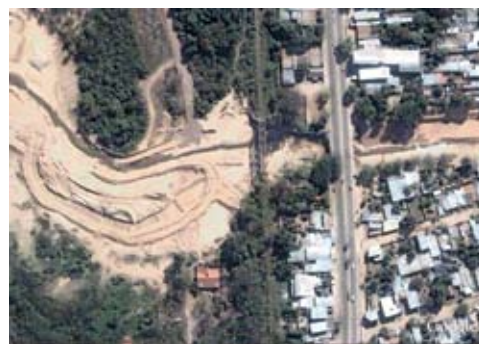
Figura 8: Puentes ferroviario y carretero sobre el río Tartagal.

La Alta Cuenca del río Tartagal presenta condiciones naturales muy críticas por sus fuertes pendientes y suelos muy erosionables. Si bien no hay desmontes para la agricultura, las condiciones de degradación provocadas por la extracción de madera, sobrepastoreo y efecto de las picadas petroleras, hacen que con lluvias torrenciales se produzcan derrumbes de laderas de los cerros.