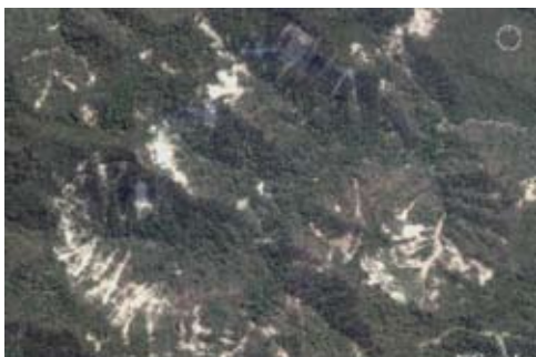
Figura 4: Derrumbes de laderas en la alta cuenca del río Tartagal.

En el mencionado informe de Proyungas se expresa que: “Existe un 0,7% deforestado en la cuenca aguas arriba de la ciudad de Tartagal” .