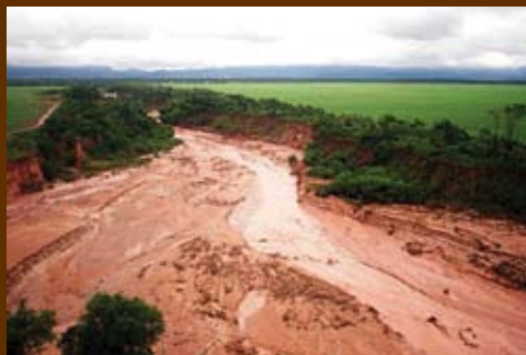
Figuras 2: Río Tartagal Alta y Baja Cuenca