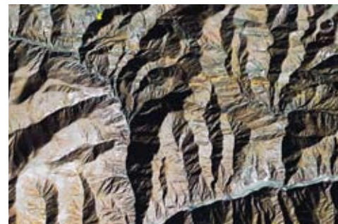
Figura 6: Derrumbes de laderas en Iruya

En la figura 7 aparece la localidad de Humahuaca, con varias áreas de derrumbes al oeste (a la izquierda) y SO, así como al NE de la misma. El ancho de la figura es de 16 kms. En el afluente del Río Grande que aparece en el ángulo SE de la imagen, se puede ver una secuencia interesante de procesos de erosión retrocedente de diversa magnitud. De más está decir que acá no hubo desmontes para agricultura, dado que las únicas parcelas agrícolas, con sus características formas regulares, están en los valles del Río Grande y del afluente mencionado.