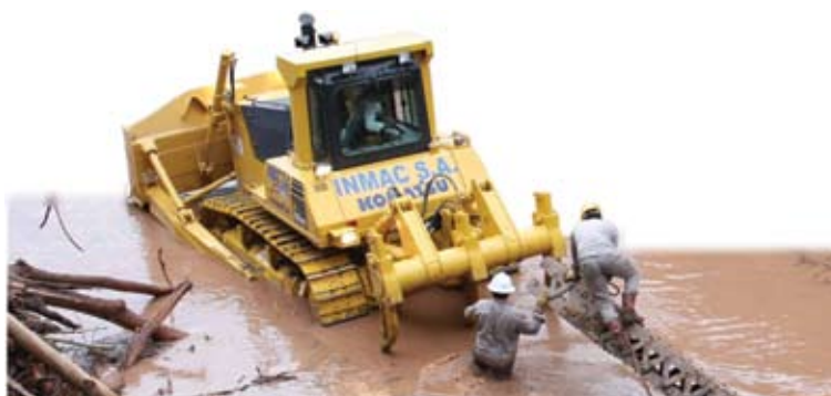
Figura 1: Humahuaca - Iruya - Tartagal - Bermejo