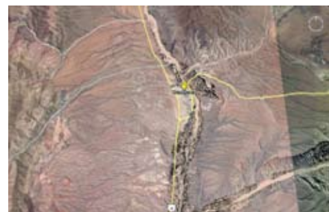
Figura 7: Derrumbes de laderas en Humahuaca