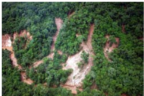
Figura 5: Foto de Greenpeace (sobrevuelo del 10/02/09). La leyenda original menciona una tala en la ladera del cerro. En realidad, se observa un derrumbe de la ladera.