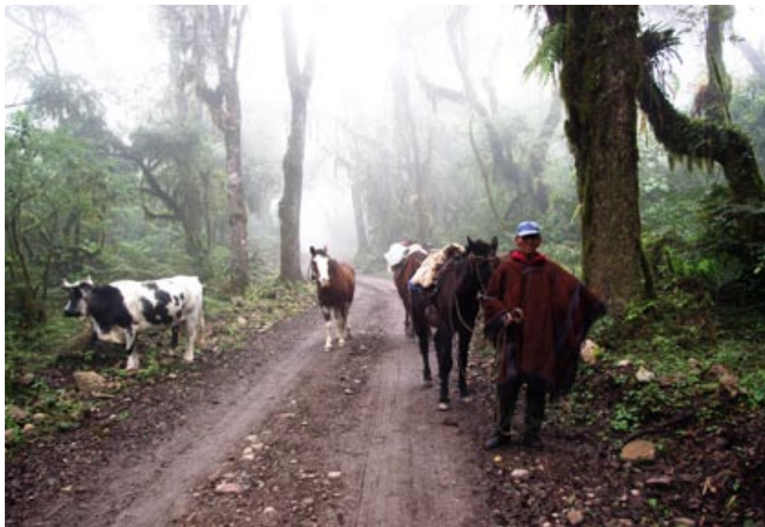
TRAHUMANCIA EN LAS YUNGAS.

Las selvas subtropicales de montaña o Yungas (o simplemente “el monte” para los lugareños) se desarrollan sobre las laderas de las montañas húmedas del noroeste de Argentina, en una angosta franja que tapiza las Sierras Subandinas de las Provincias de Salta, Jujuy, Tucumán y Catamarca y continúan hacia el norte, siguiendo a los Andes hasta Colombia y Venezuela. Y por supuesto por ahí, a lo largo y a lo ancho anda el ucumar buscando su sustento, por las umbrías oquedades del bosque nublado, entre peñas y árboles tortuosos cubiertos de musgos, enredaderas y epífitos, muy dentro de la nuboselva. Un ambiente nuevo para los habitantes urbanos de nuestro país que en general desconocían hasta hace apenas una década la existencia de esta vastedad de selvas y biodiversidad. En las 5 millones de hectáreas que ocupa este ambiente en Argentina, habitan más de la mitad de especies de plantas y animales del país!