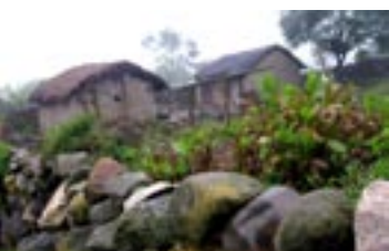
BUEYES ARANDO. CASAS EN SAN ANDRÉS, SALTA.