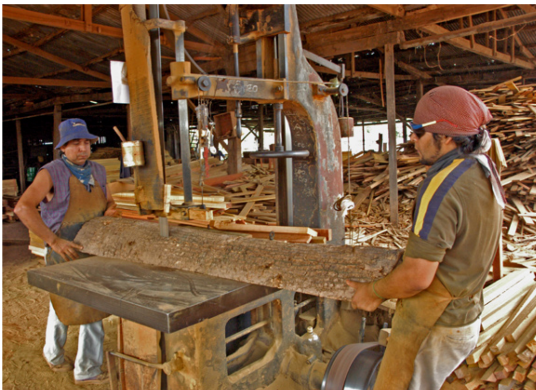
ASERRADERO TRADICIONAL EN LA ZONA DEL PEDEMONTE DE LAS YUNGAS.