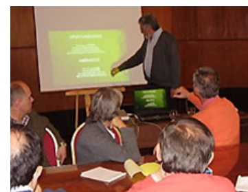
PRESENTACIÓN DEL PLAN FORESTAL, SALTA.

El desarrollo de este drama, que ha castigado principalmente a quienes intentaba proteger, se debe a rasgos característicos de nuestra sociedad: