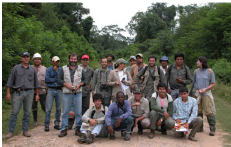
EQUIPO MULTICLIPLINARIO DE INVENTARIO FORESTAL EN FINCA PILOTO.

Este fallo de la Corte Suprema, lamentablemente no diferencia entre quienes transforman importantes superficies forestales para ampliar la frontera agropecuaria (que en realidad son los que motivaron tanto la ley de bosques como la reciente resolución de la Corte), y aquellos que basan hoy su producción en el manejo forestal sostenible, actividad fundamental para darle valor al bosque y asegurar su persistencia en extensas superficies. Incluidas entre estos usuarios del bosque a las co-