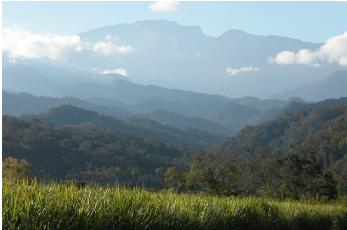
CAÑAVERAL Y ZONA DE AMORTIGUAMIENTO DEL INGENIO LEDESMA, JUJUY. AL FONDO EL PARQUE NACIONAL CALILEGUA DONADO POR LA MISMA EMPRESA"

que no sería otra cosa que el POT que la Provincia debe realizar, dado que este último justamente es poner de relieve la totalidad de las áreas sujetas a transformación, identificar las áreas que se deben proteger de tal manera de tener una visión de la expansión de la frontera agropecuaria y sus impactos acumulados.